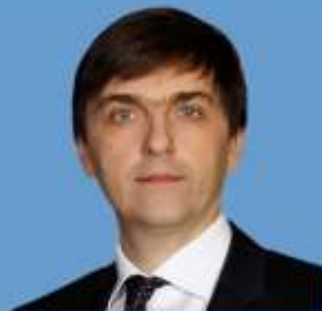
МИНИСТР ПРОСВЕЩЕНИЯ РФ КРАВЦОВ СЕРГЕЙ СЕРГЕЕВИЧ

"РЕБЕНОК В ДОШКОЛЬНОМ ВОЗРАСТЕ ДОЛЖЕН МАКСИМАЛЬНО РАЗВИВАТЬСЯ, ОН ДОЛЖЕН ОБЩАТЬСЯ СО СВЕРСТНИКАМИ, ИГРАТЬ, У НЕГО ДОЛЖНЫ РАЗВИВАТЬСЯ ВСЕ ОСНОВНЫЕ ПСИХОЛОГИЧЕСКИЕ ФУНКЦИИ. А В ШКОЛЕ ЕГО УЖЕ ПОТОМ НАУЧАТ ЧИТАТЬ И ПИСАТЬ"